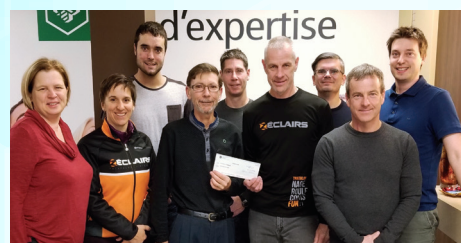
Club de triathlon Les Zéclairs