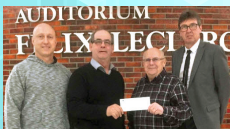
Fondation de l'école secondaire Jean-Nicolet

LE PROGRAMME EST DE RETOUR POUR L'ANNÉE 2018-2019 AVEC LES ORGANISMES SUIVANTS :