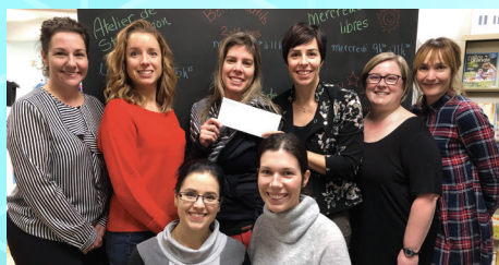
Lu-Nid Maison de la famille

Grâce à vous, les trois organismes gagnants de la première édition du concours « Redonner à la collectivité » profitent d'une aide financière pour soutenir leur mission en lien avec la jeunesse. En effet, au cours de la dernière année, pour chaque ouverture d'un nouveau compte admissible, la Caisse a remis, au choix du membre, un montant de 5 $ à l'un des trois organismes de l'édition 2017-2018. Félicitations!