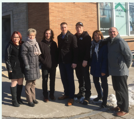
En 2017, cinq entreprises ont profité de ce programme et ont reçu 60 000 $ en financement.

En collaboration avec des organismes du milieu, votre Caisse permet aux personnes qui en ont besoin d'obtenir un accompagnement budgétaire ou un financement adapté à leur situation par l'entremise du programme de financement CRÉAVENIR créé pour soutenir les jeunes entrepreneurs.