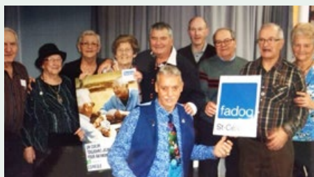
La FADOQ de Saint-Célestin organise plusieurs activités pour les aînés de la municipalité.

Les clubs d'âge d'or contribuent au mieux-être des personnes âgées en tenant régulièrement des activités de toutes sortes auxquelles votre caisse a participé. Les membres peuvent ainsi entretenir une vie sociale épanouie tout en conservant et en améliorant leur qualité de vie.