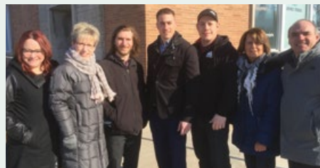
En 2017, cinq entreprises ont profité du programme et ont reçu 60 000 $ en financement.

En collaboration avec des organismes du milieu, votre caisse permet aux personnes qui en ont besoin d'obtenir un accompagnement budgétaire ou un financement adapté à leur situation par le biais du programme de financement CRÉAVENIR créé pour soutenir les jeunes entrepreneurs.