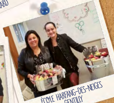
ÉCOLE HARFANG-DES-NEIGES GENTILLY