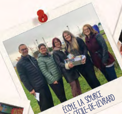
ÉCOLE LA SOURCE SAINTE-CÉCILE-DE-LÉVRARD