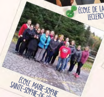
ÉCOLE MARIE-SOPHIE SAINTE-SOPHIE-DE-LÉVRARD