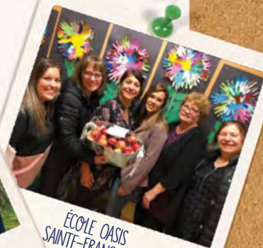
ÉCOLE OASIS SAINTE-FRANÇOISE