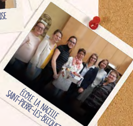
ÉCOLE LA NACELLE SAINT-PIERRE-LES-BECQUETS