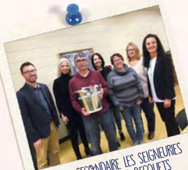
ÉCOLE SECONDAIRE LES SEIGNEURIES SAINT-PIERRE-LES-BECQUETS