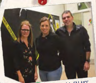
ÉCOLE DE LA FALAISE LECLERCVILLE