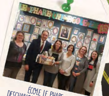
ÉCOLE LE PHARE DESCHAILLONS-SUR-SAINT-LAURENT

Pour bien conclure la Semaine de la coopération 2019, des employés et des administrateurs de la Caisse ont fait une visite surprise dans les écoles primaires et secondaire de la région pour gâter le personnel enseignant et non enseignant. Ils ont souligné leur dévouement et leur engagement quotidiens auprès des jeunes et ont profité de leur présence pour les remercier personnellement.