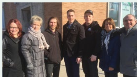
En 2017, cinq entreprises ont profité du programme et ont reçu 60 000 $ en financement.

En collaboration avec des organismes du milieu, votre caisse permet aux personnes qui en ont besoin d'obtenir un accompagnement budgétaire ou un financement adapté à leur situation par le biais du programme de financement CRÉAVENIR créé pour soutenir les jeunes entrepreneurs.