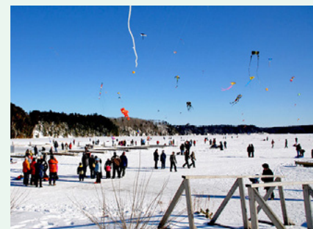
Tout un spectacle aérien dans le ciel de Grandes-Piles!

La Caisse est fière de soutenir cet événement familial hivernal unique! La rivière Saint-Maurice devient le terrain de jeu d'une cinquantaine de cerfs-volistes et accueille plus de 5 000 festivaliers pour l'occasion. Félicitations au comité organisateur et aux bénévoles de nous émerveiller, année après année!