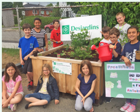
Chaque classe de l'école a la responsabilité de cultiver, et d'entretenir son «Smart pots»

Un immense verger a été mis en place grâce à 13 «Smart pots» sur le terrain bétonné de l'école Antoine-Hallé. Toutes les récoltes sont partagées avec la communauté. Des animations-dégustations sont organisées afin de faire connaître aux enfants et à la communauté les différents produits et leur production. Un projet coopératif formidable! Ensemble, cultivons l'avenir.