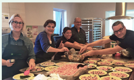
L'équipe Desjardins du CuisinOthon 2017. L'implication de notre capital humain, c'est aussi ça la différence Desjardins.

La Caisse est partenaire de l'événement dans le cadre de la Semaine de la Coopération. De plus, une équipe d'employés de Desjardins met la main à la pâte lors de ce marathon culinaire! C'est plus de 5 000 portions qui ont été cuisinées pour les familles dans le besoin du secteur pendant cette journée. Une belle action qui vient souligner le thème de la jeunesse de la Semaine de la Coopération.