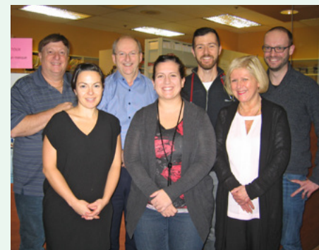
L'équipe médicale de la Coopérative de Solidarité Santé Shawinigan

La Caisse s'est associée à la coopérative de santé dans le cadre d'un projet d'acquisition d'équipements médicaux et l'embauche d'un médecin supplémentaire, en mesure de répondre à plus de 500 nouveaux patients. La Coopérative de Solidarité Santé Shawinigan compte près de 5 000 membres.