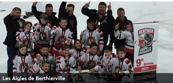
Les Aigles de Berthierville