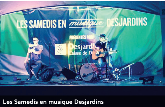
Les Samedis en musique Desjardins

Lors de la collecte de fonds annuelle du Centre d'action bénévole D'Au-tray (CABA), la Caisse a bonifié son appui à l'organisme en doublant les dons qui ont été faits par les membres. C'est avec fierté qu'elle a versé 11 522 $ à l'organisme, venant s'ajouter au montant de 15 000 $ déjà versé annuellement par la Caisse à titre de principal partenaire, et ce, afin de soutenir la réalisation d'activités et la promotion de ses services.