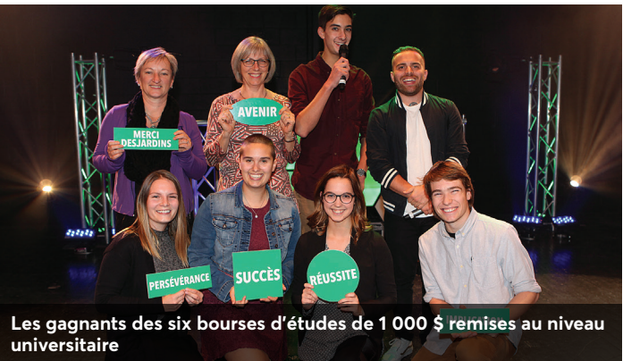
Les gagnants des six bourses d'études de 1 000 $ remises au niveau universitaire

c'est soutenir l'éducation financière des jeunes