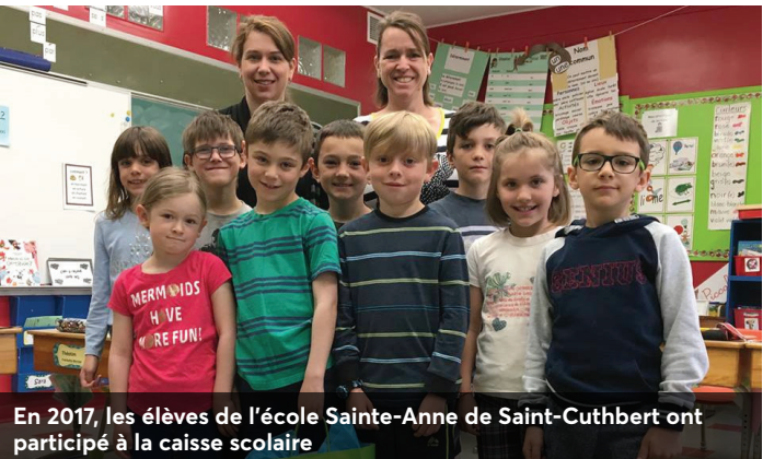
En 2017, les élèves de l'école Sainte-Anne de Saint-Cuthbert ont participé à la caisse scolaire

Notre caisse participe également au programme de la caisse scolaire . Grâce à celle-ci, les enfants de nos 13 écoles primaires peuvent apprendre, entre autres, la valeur de l'argent et des biens de consommation ainsi que l'importance de se fixer un objectif d'épargne et de respecter ses engagements. Découvrez une foule d'activités, de vidéos et de jeux au www.caissescolaire.com !