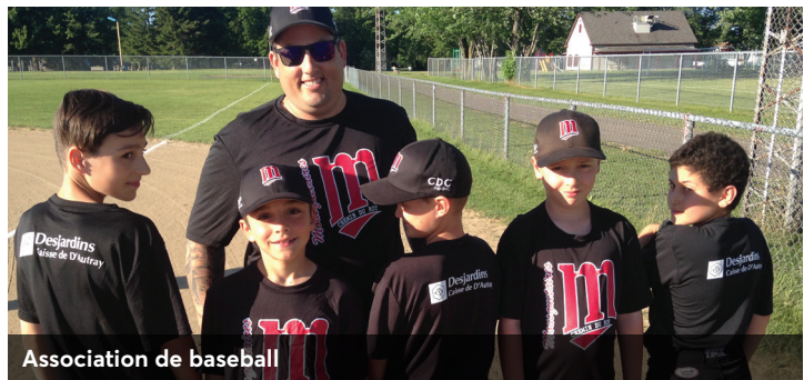
Association de baseball