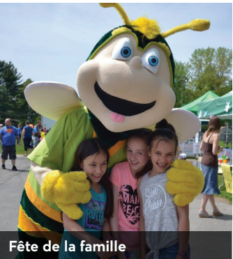
Fête de la famille