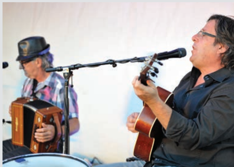
LES MARDIS D'AOÛT | Municipalité de Saint-Paul