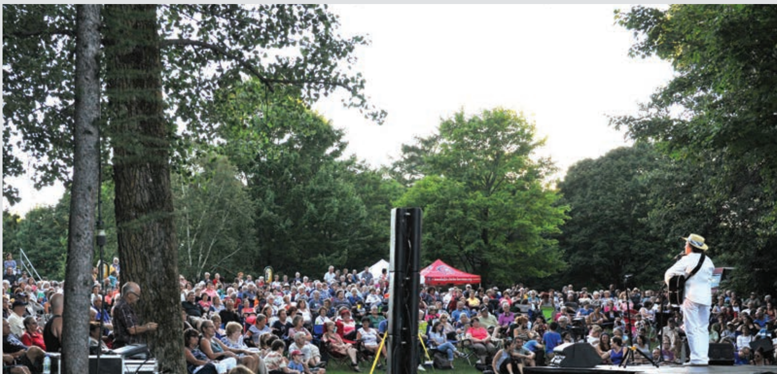
BOSCO NATURELLEMENT MUSICAL | Municipalité de Saint-Charles-Borromée