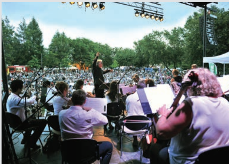
LES JEUDIS MUSIK'EAU | Ville de Notre-Dame-des-Prairies

Toute une fierté de s'associer à des spectacles et des concerts de qualité en plein-air, des événements qui occupent une place importante dans notre communauté. On les transforme en sorties familiales ou en rencontres entre amis. Des spectacles courus par des milliers de lanaudois de toutes générations qui s'y donnent rendez-vous. Apportez votre chaise et bon spectacle!