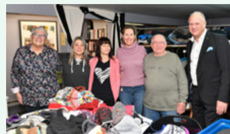
Comptoir vestimentaire La Corde à Linge de Saint-Jean-de-Matha