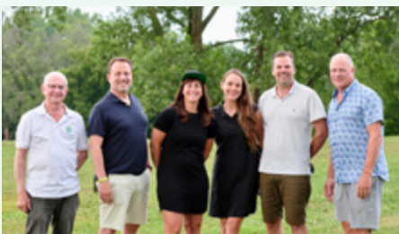
Festival Mémoire et Racines