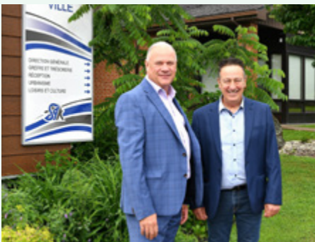
Municipalité de Saint-Ambroise-de-Kildare – Piste cyclable et piste à vagues