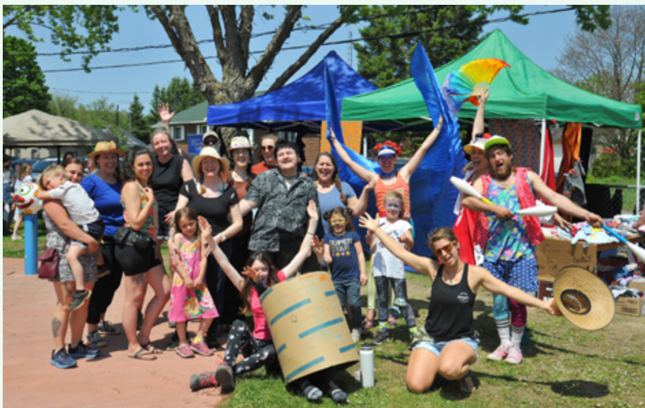
Défi-Famille Matawinie – Fête Écofamiliale