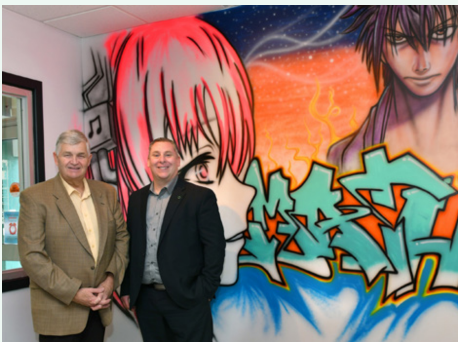
Municipalité de Saint-Jean-de-Matha – Bibliothèque Louis-Landry