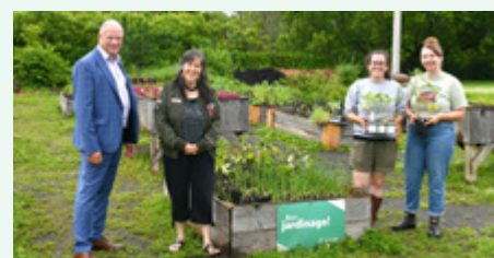
La Soupière Joliette-Lanaudière – Forêt nourricière