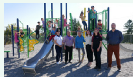
École des Moulins