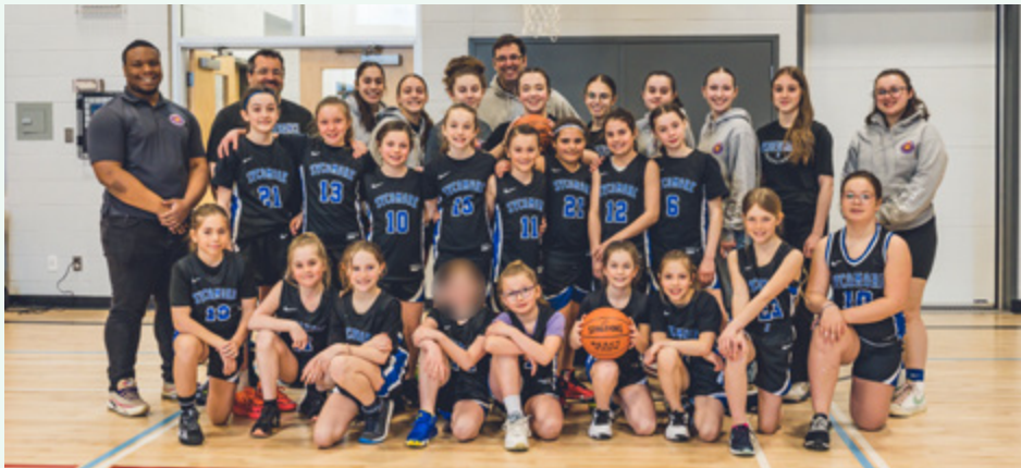
Association de basketball Persévérance