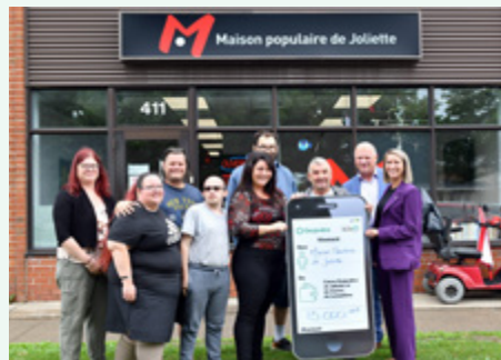
La Maison populaire de Joliette