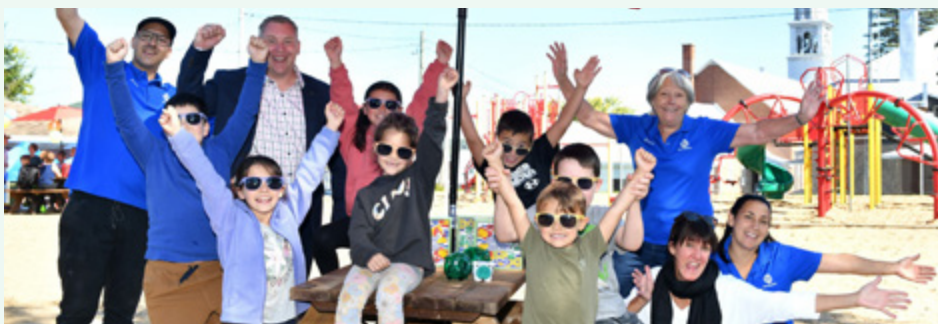
Club optimiste de Sainte-Béatrix et École Panais