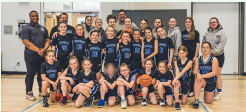
Association de basketball Persévérance