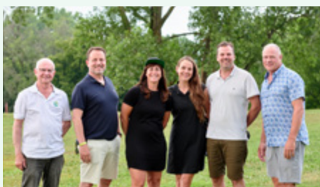
Festival Mémoire et Racines