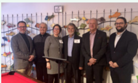
Aux bonheurs des aînés

Voici quelques moments marquants de l'année.