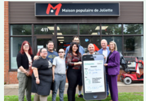
La Maison populaire de Joliette