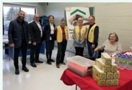
Club optimiste de Saint-Paul – Clinique de sang