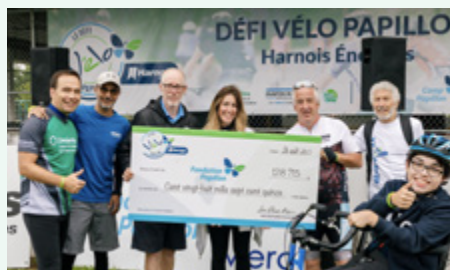
Camp Papillon – Défi-Vélo Papillon