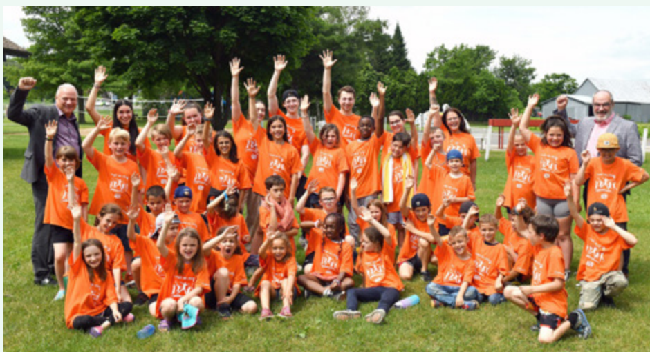
Municipalité de Notre-Dame-de-Lourdes – Camp de jour