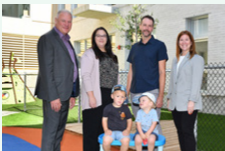
Centre de la petite enfance des Amis des Prairies