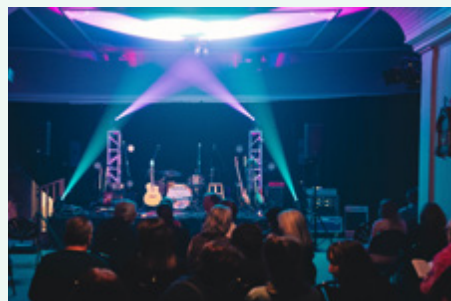
Municipalité de Sainte-Marcelline-de-Kildare – Vielle Chapelle