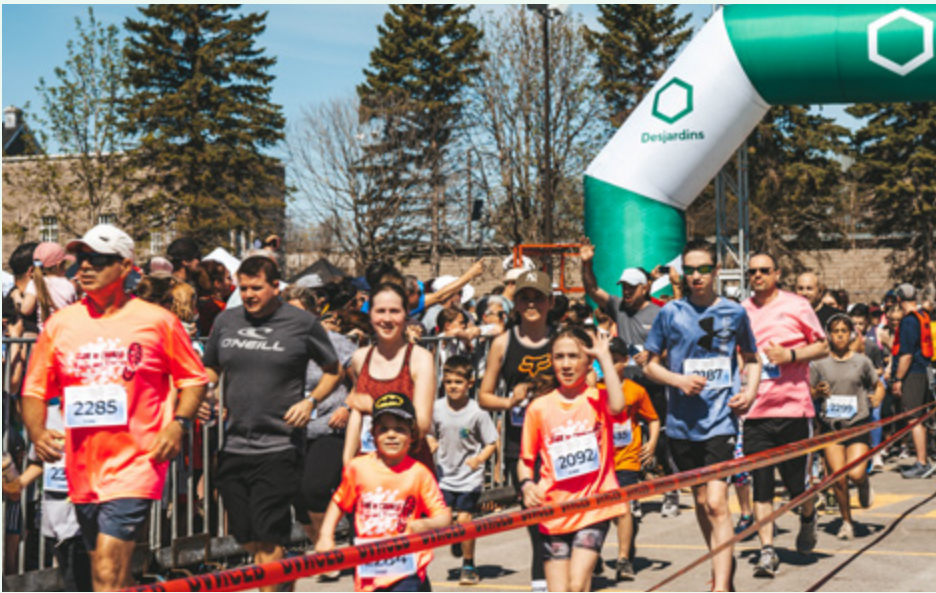
Fondation des Samares – Courses aux 1000 pieds