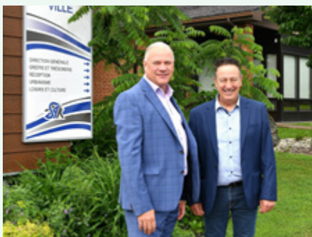
Municipalité de Saint-Ambroise-de-Kildare – Piste cyclable et piste à vagues