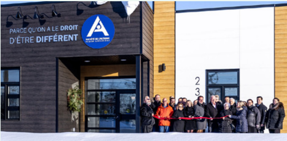
Société de l'Autisme Région Lanaudière