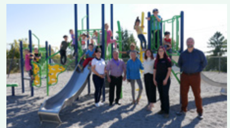
École des Moulins