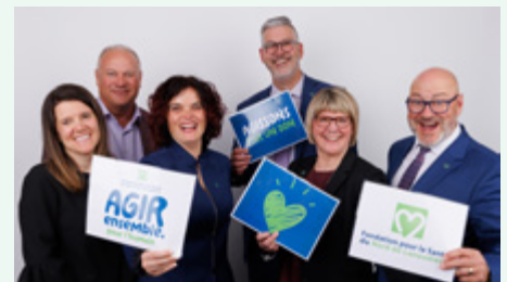
Fondation pour la Santé du Nord de Lanaudière