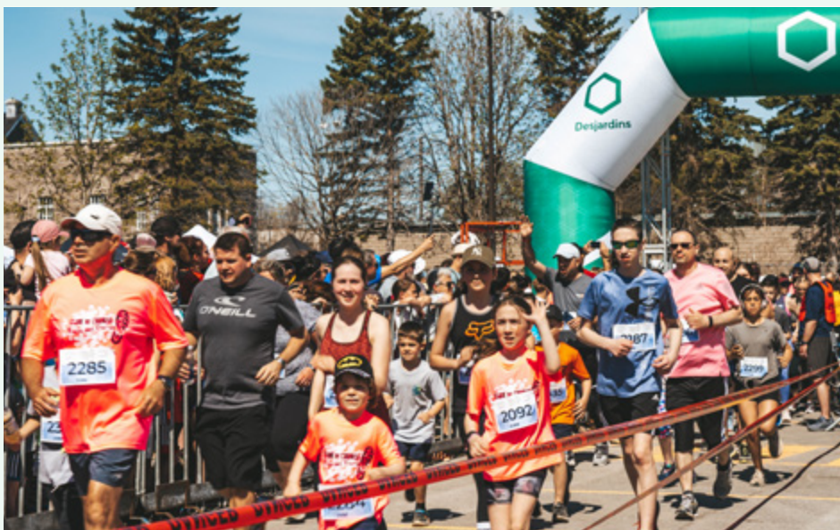
Fondation des Samares – Courses aux 1000 pieds