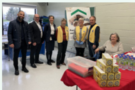
Club optimiste de Saint-Paul – Clinique de sang