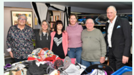
Comptoir vestimentaire La Corde à Linge de Saint-Jean-de-Matha