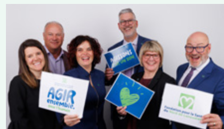
Fondation pour la Santé du Nord de Lanaudière