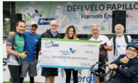
Camp Papillon – Défi-Vélo Papillon