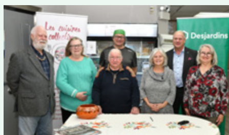
Les Cuisines collectives de Matha