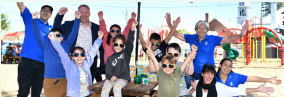
Club optimiste de Sainte-Béatrix et École Panet