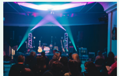
Municipalité de Sainte-Marcelline-de-Kildare – Vielle Chapelle