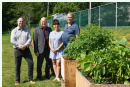
Municipalité de Saint-Félix-de-Valois – Jardin collectif pédagogique