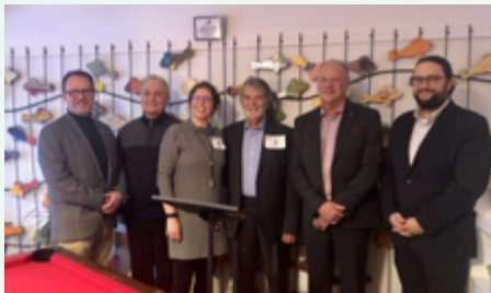
Aux bonheurs des aînés

Voici quelques moments marquants de l'année.