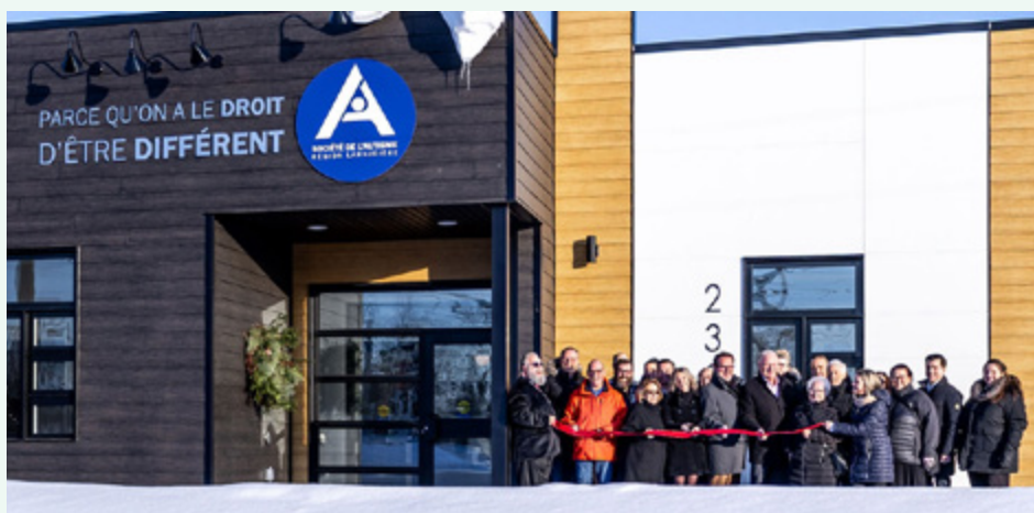
Société de l'Autisme Région Lanaudière