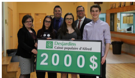
Boursiers du programme de bourses d'études des caisses de l'Ontario