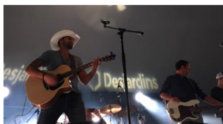
Festival de la Curo