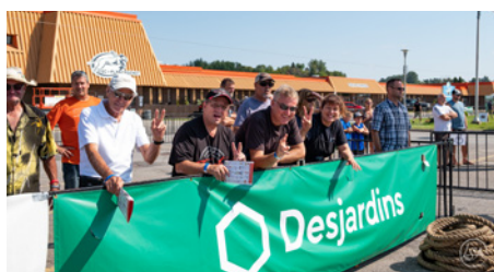
Festival de la Bine de Plantagenet