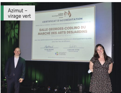
Azimet – virage vert