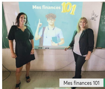
Mes finances 101