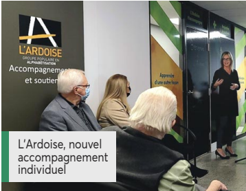
L'Ardoise, nouvel accompagnement individuel