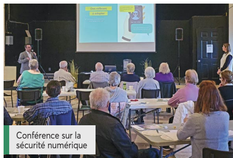
Conférence sur la sécurité numérique

Merci à nos employés qui font vivre quotidiennement les valeurs de la coopération!