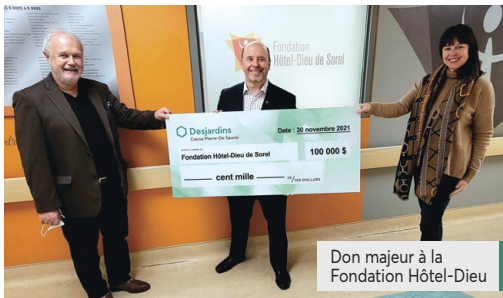
Don majeur à la Fondation Hôtel-Dieu