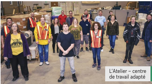
L'Atelier – centre de travail adapté