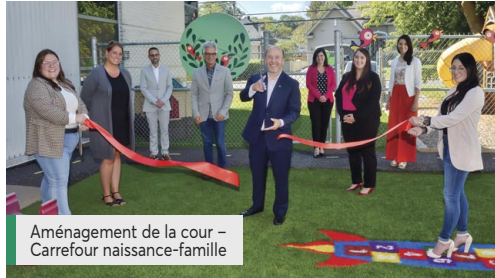
Aménagement de la cour – Carrefour naissance-famille