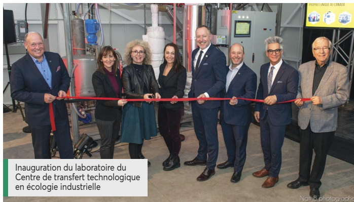
Inauguration du laboratoire du Centre de transfert technologique en écologie industrielle

Le Fonds du Grand Mouvement demeure l'une de nos initiatives phares pour contribuer à la relance socioéconomique et à la vitalité des régions. Doté d'une enveloppe de 250 M$, ce fonds soutiendra des projets structurants jusqu'en 2024. Il s'agit d'un levier formidable pour appuyer des projets mis sur pied par les communautés et ayant le potentiel de transformer notre société. Encore cette année, des idées porteuses d'espoir ont émergé : le nouveau laboratoire du Centre de transfert technologique en écologie industrielle en est un bel exemple. Nous sommes ravis du rôle que nous avons pu jouer dans la concrétisation de ce projet aux retombées positives.