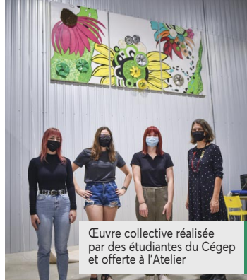
Œuvre collective réalisée par des étudiantes du Cégep et offerte à l'Atelier