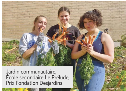
Jardin communautaire, École secondaire Le Prélude, Prix Fondation Desjardins