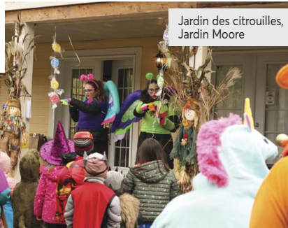
Jardin des citrouilles, Jardin Moore