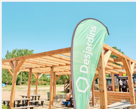
Bar-terrasse Desjardins à la plage du RécréoParc.

Desjardins est fier de s'associer au RécréoParc à titre de partenaire majeur dans le cadre de la modernisation de ses infrastructures et de la bonification de son offre de service à la population pour devenir, d'ici quelques années, l'une des plus importantes destinations touristiques de la région. Véritable joyau dans la nature, on y trouve une grande plage de sable avec son nouveau bar-terrasse, des sentiers pour le vélo et la randonnée, une zone nautique aménagée pour le kayak et la pêche, un café-resto avec une vue saisissante sur les rapides et un camping urbain pour savourer pleinement la beauté de la nature à proximité de la ville.