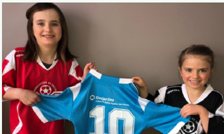
Les joueuses arborent fièrement leur nouveau chandail de l'Association de soccer.

Grâce à notre contribution, l'Association de soccer de Sainte-Agathe-des-Monts a pu renouveler son inventaire de chandails de soccer pour le grand plaisir de tous. Les joueurs ont donc accès à des chandails neufs, plus modernes et arborant fièrement le logo Desjardins.