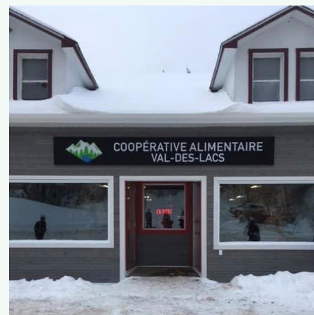
L'entrée de la Coopérative alimentaire Val-des-Lacs.

Participer financièrement au projet de création d'une coopérative alimentaire pour répondre aux besoins d'offrir un service de proximité en alimentation aux citoyens et aux vacanciers de Val-des-Lacs. Cette nouvelle coopérative permet entre autres d'offrir un service alimentaire de qualité à ses membres, de contribuer au développement économique, social et communautaire de Val-des-Lacs, d'encourager l'économie locale, et favorise le développement de notre communauté.