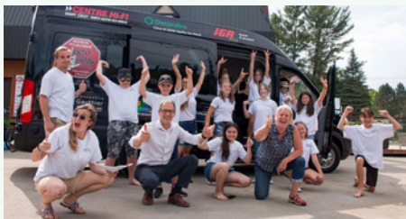
Les jeunes célèbrent l'arrivée du minibus.

C'est grâce à la force d'une collectivité que la Maison des jeunes de Saint-Adolphe-d'Howard a pu se procurer un minibus qui assure le transport des jeunes vers diverses activités. En effet, de nombreux partenaires incluant Desjardins se sont mobilisés pour permettre à ce rêve de voir le jour.