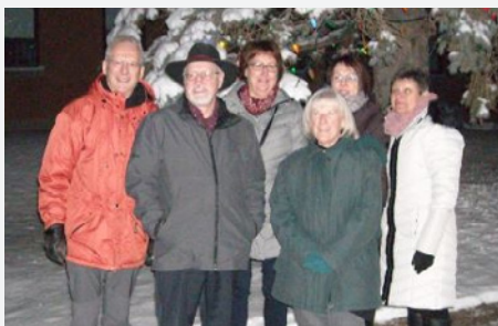
Le conseil d'administration de la Fondation Philippe-Chabot

La collecte de fonds de la Fondation Philippe-Chabot lui permet de contribuer au mieux-être des personnes âgées vivant en centres d'hébergement publics sur le territoire de la MRC de Témiscamingue. Depuis plusieurs années, Desjardins soutient cette cause et permet d'éclairer l'arbre de lumières, emblème de l'organisation.