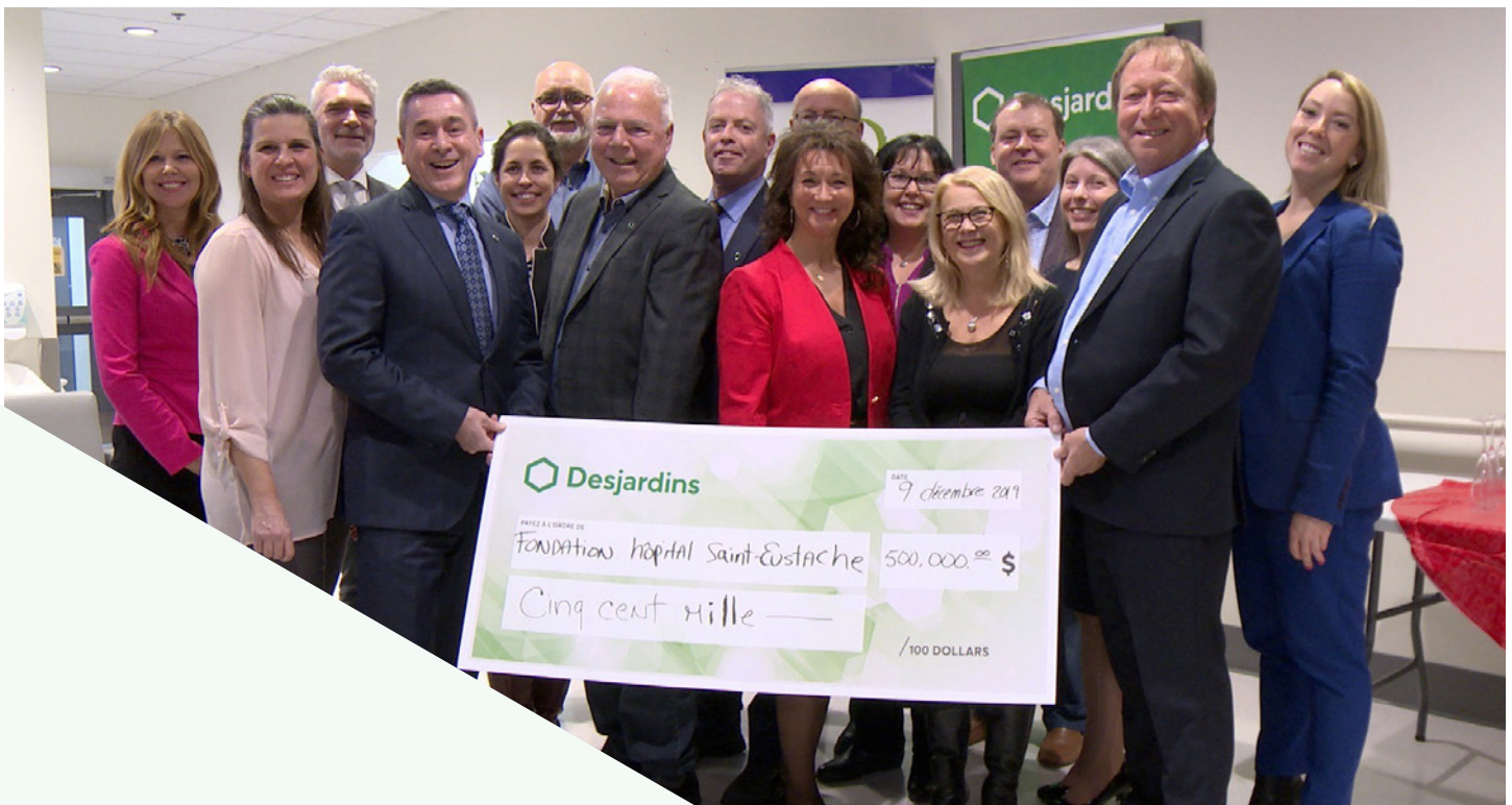
Inauguration du Centre de santé Desjardins.