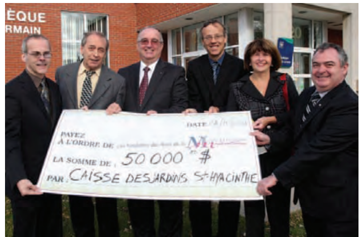
La Médiathèque maskoutaine a reçu un don de 50 000 $ lui permettant de recevoir une subvention gouvernementale et d'ainsi se procurer 6 500 volumes supplémentaires.