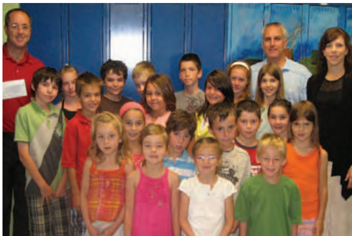
Les 12 écoles se trouvant sur le territoire de la Caisse ont reçu un don équivalent à 12 $ par élève. Au total, 45 316 $ ont été remis aux écoles primaires maskoutaines et de Saint-Barnabé-Sud.

EN 2010, LA CAISSE DESJARDINS DE SAINT-HYACINTHE A REMIS, PAR LE BIAIS DE SON PROGRAMME DES DONS ET COMMANDITES, PLUS DE 525 000 $ AU NOM DE SES MEMBRES À DES ORGANISMES MASKOUTAINS QUI AIDENT DES GENS DANS LE BESOIN ET QUI OFFRENT DES SERVICES À LA POPULATION.