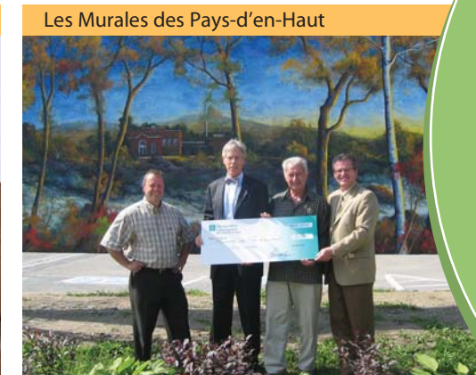
Depuis quelques années votre Caisse contribue à l'embellissement des villes, entre autre par Les Murales des Pays-d'en-Haut.