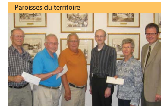
Contribution annuelle aux paroisses de Sainte-Marguerite-du-Lac-Masson, Saint-Joseph de Mont-Rolland et Sainte-Adèle.