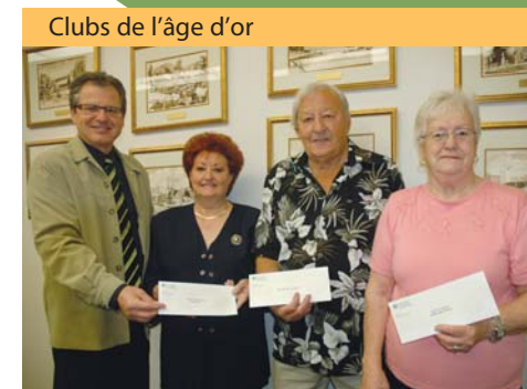
Remise aux membres des clubs de Lac-Masson, Sainte-Adèle et Mont-Rolland afin de leur permettre d'organiser d'avantage d'activités.