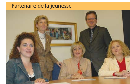
Contribution à différents projets pour chacune des 4 écoles primaires du territoire.