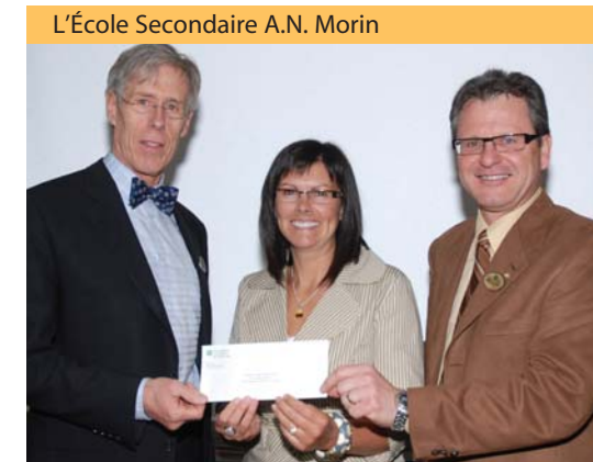
Engagement de 20 000 $ pour une période de 3 ans comme partenaire pour des projets majeurs à la revitalisation de l'École secondaire A.N. Morin.