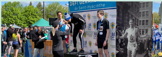
Club athlétique de Saint-Hyacinthe