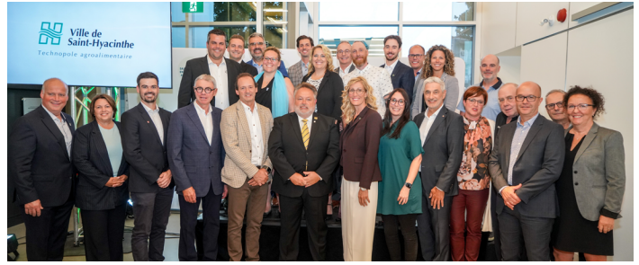
Culture 150 000 $ pour la nouvelle Bibliothèque T.A.-St-Germain