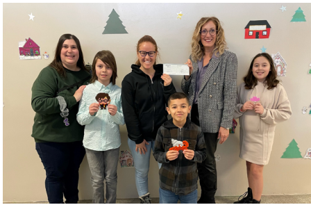
Éducation 111 000 $ en bourses diverses et 65 000 $ via notre Programme de soutien aux écoles primaires