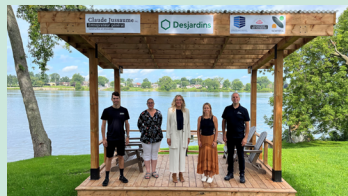
Chez Nelson Café-bistro