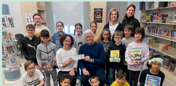
Écoles primaires de notre milieu