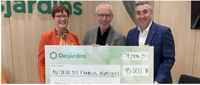
Santé et saines habitudes de vie 45 000 $ octroyés à l'organisme Au cœur des familles agricoles avec Desjardins Entreprises