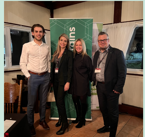
Chambre de commerce de la grande région de Saint-Hyacinthe