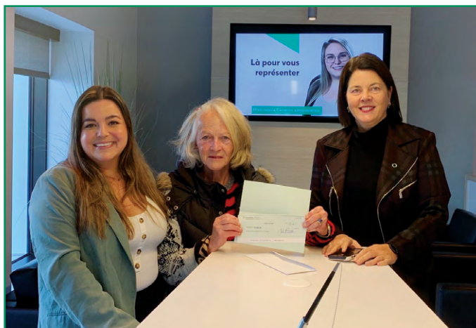
Par sa contribution, la Caisse a permis la réfection du sentier écologique de la Haute-Etchemin. Un autre pas en avant pour faciliter l'adoption de saines habitudes de vie.