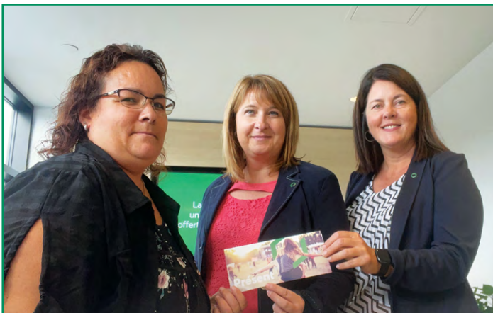
La Caisse supporte financièrement le Club de soccer Sainte-Justine qui permet à de nombreux jeunes membres de pratiquer leur passion.