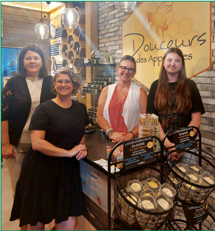
Le programme Desjardins Jeunes au travail était de retour en 2023. Quatre jeunes et entreprises du territoire, dont Douceurs des Appalaches, ont ainsi profité des avantages du programme.