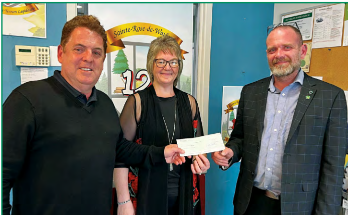
La Caisse est partenaire des festivités entourant le 125 e anniversaire de Sainte-Rose de Watford.