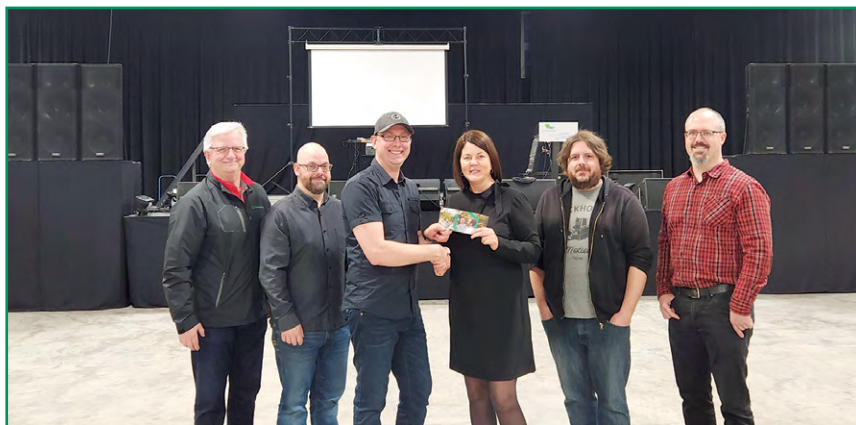
Le premier Caribou festif est né de l'audace de passionnés de musique et de leur ergon. La Caisse est fière d'avoir figuré parmi les grands partenaires de l'événement.