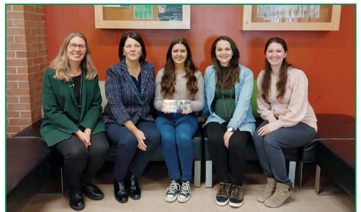
La Fondation de l'école des Appalaches reçoit le soutien de la Caisse chaque année afin d'enrichir l'offre d'activités aux élèves. De plus, une bourse Leadership Desjardins de 500 $ est remise chaque année à un élève méritant lors du gala d'excellence en juin.