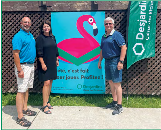
La Caisse remettait 10 000 $ cette année à l'Éco-Parc dans le cadre du projet de réalisation des fameuses glissades d'eau Aquatwist.

Par le biais de dons, de commandites ou de contributions du Fonds d'aide au développement du milieu, votre caisse appuie plusieurs initiatives communautaires locales et régionales dans différents secteurs. Voici quelques-unes des initiatives soutenues au cours de la dernière année.