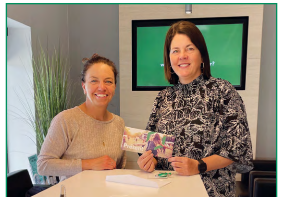
Le Triathlon de Lac-Etchemin compte sur le soutien de la Caisse à titre de partenaire majeur depuis sa création.