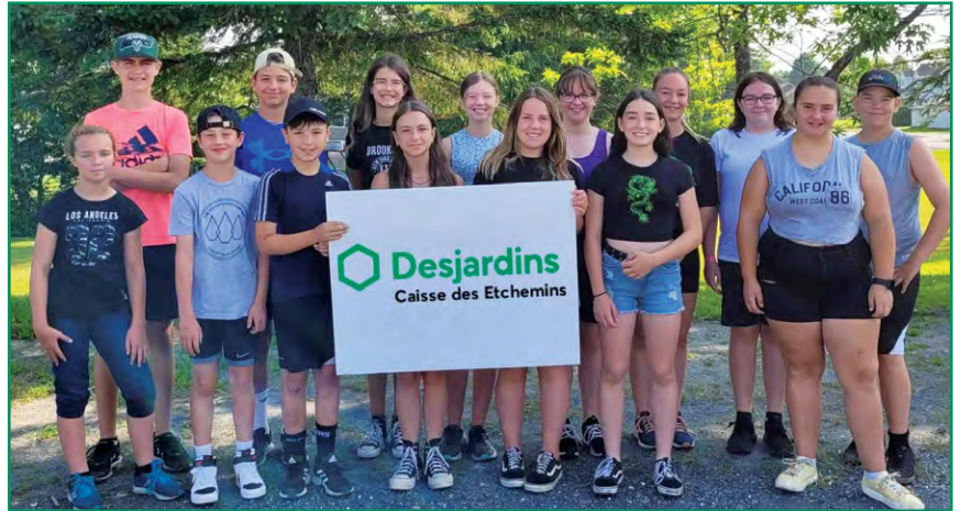
Le camp pour ados Desjardins de la Maison de jeunes l'Olivier des Etchemins permet à de nombreux jeunes d'ici de vivre un été enrichissant.